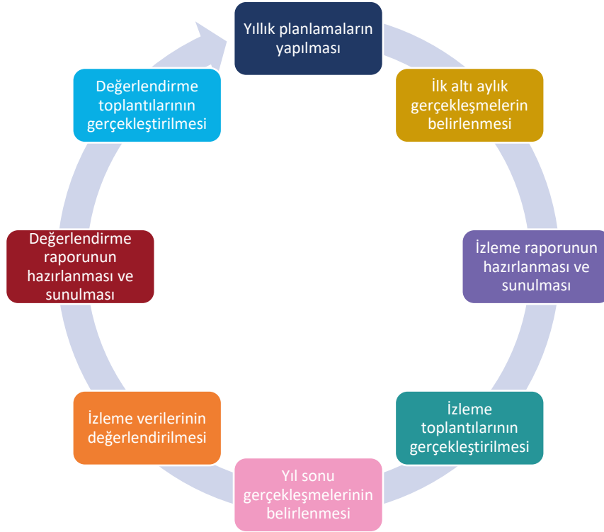
Şekil 3: İzleme ve değerlendirme süreci

Sürmene Şehit Muhammet Yıldız Anadolu İmam Hatip Lisesi için izleme değerlendirme faaliyetleri, izleme ve değerlendirme şablonu kullanılarak her eğitim-öğretim dönemi sonunda bir kere olacak şekilde gerçekleştirilecektir. İzleme ve değerlendirme faaliyetleri sonucunda elde edilen bilgiler kullanılarak okulumuz Sürmene Şehit Muhammet Yıldız Anadolu İmam Hatip Lisesi 2024-2028 Stratejik Planı gözden geçirilecek, hedeflenen ve ulaşılan sonuçlar karşılaştırılacaktır. Bu karşılaştırmalar sonucunda da gerekli görülen durumlarda stratejik plan güncellenebilecektir. Amaç ve hedeflere kaydedilen ilerlemeyi takip etmek amacıyla uygulama öncesi ve uygulama sırasında sürekli ve sistematik olarak nitel ve nicel veriler toplanacak ve analiz edilecektir. Performans göstergeleri aracılığıyla amaç ve hedeflerin gerçekleşme sonuçları her yılın ilk altı ayında izlenecek ve belirlenen dönemler itibarıyla raporlanarak okul müdürünün değerlendirilmesine sunulacaktır.