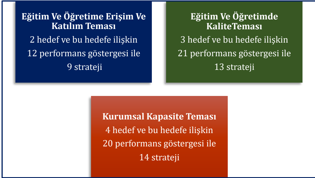
Şekil 2: Tema, hedef ve performans göstergeleri

Olmak üzere Sürmene Şehit Muhammet Yıldız Anadolu İmam Hatip Lisesi 2024-2028 Stratejik Planı'nda toplamda 9 hedef, 53 performans göstergesi ve 36 strateji bulunmaktadır.